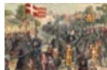
► Розгляньте малюнок і складіть розповідь на тему: «Визід рицарів госпітальєрів з Єрусалиму»

Незважаючи на постійне перебування в бойовій готовності, становище хрестоносців на Сході не було міцним. У середині XII ст. селяджуки перейшли в наступ. Вони проголосили джихад — священну війну ісламу проти невірних. Єрусалимський король, утративши більшу частину своїх володінь, звернувся по допомогу до Папи, який у відповідь оголосив другий хрестовий похід (1147–1149 рр.). Незважаючи на значні військові сили (50 тис. воїнів), що вель із собою німецький імператор Конрад III і французький король Людовік VII,