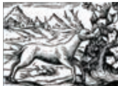
Олень. Середньовічна гравюра.

Важливу суспільну роль відігравав тоді ландшафт. Так, рівнинні землі сприяли появі сіл, а порізанний рельєф змушував до хуторського розселення, дроблення рілі.