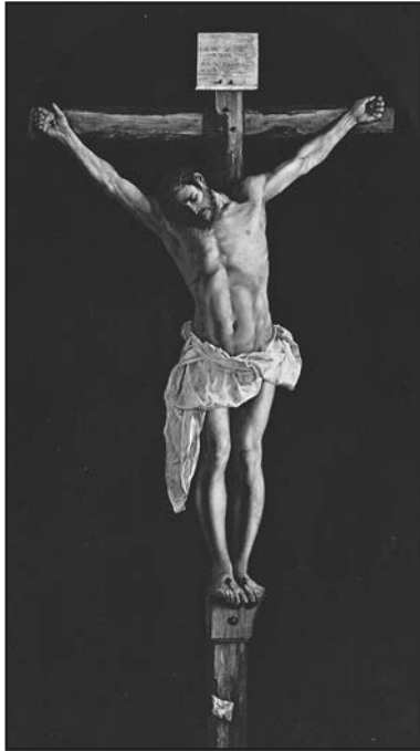
Франціско де Сурбаран. Розп'яття.

Одним з найуспішніших тренерів в історії професійного футболу був Вінс Ломбардії, який тренував команду Грін Бан Пакерс. Якось журналіст запитав футболістів: «Чому ваша команда так сильно відрізняється від інших? Чому ви так викладаєтесь?» Гравці відповіли: «Бо ми граємо не для натовпу, що зібрався на стадіоні, і не для мільйонів глядачів, що зібралися біля екранів телевізорів. Ми граємо тільки для одного — для тренера. Коли проглядаємо запис гри вранці у понеділок, то хочемо знати, що наша гра сподобалася тренерові». Так і справжні християни живуть не для натовпу, а для того, щоб своїм життям зробити приємне Отцеві Небесному. Ми маємо жити і працювати заради Бога і свого ближнього.