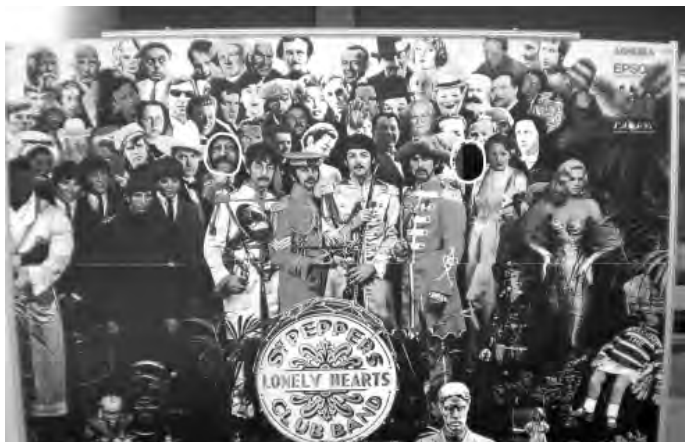
Можна сфотографуватись із знаменитостями. Автор поруч із Ленноном. Віконце біля Харрісона вільне...