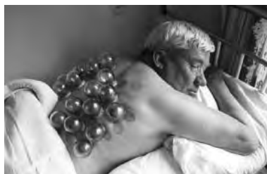
Back in the USSR...