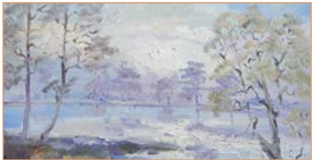
А. Колос. Рання весна.