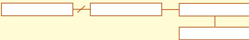
Схема цього речення така:

256. Спишіть прислів'я. Накресліть схеми кожного речення.