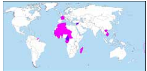
Французька колоніальна імперія

За період від 1870 до 1914 р. французи збільшили територію своїх володінь у 10 разів.