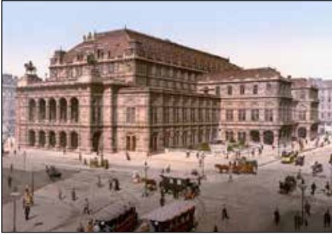
Віденська придворна опера