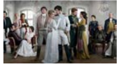
Кадр із міні-серіалу Е. Девіса «Війна і мир»