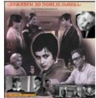
Афіша фільму «Доживемо до понеділка»