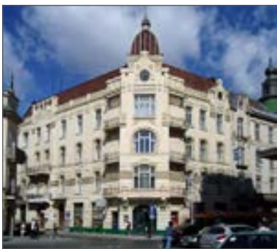
Прибутковий будинок Адольфа Сегаля, Львів. Арх. Т. Обмінський, 1905 р.

За роки розвитку української сецесії було збудовано понад 500 об'єктів, багато із яких збереглися й донині та стали характерною прикрасою міст.