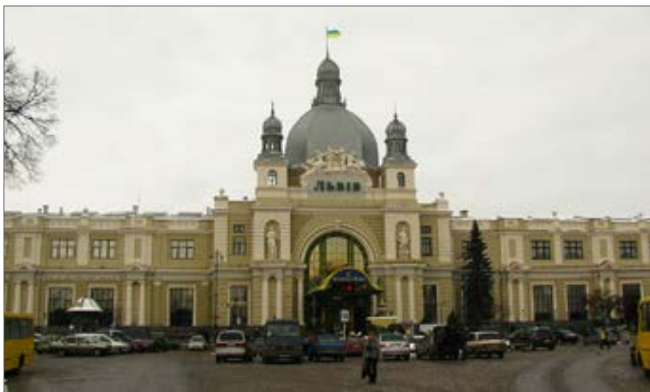
Залізничний вокзал Львова

Розгляньте детально зображення (с. 49, 50) сецесійних споруд. Які характерні ознаки цього стилю ви можете виділити? Розкажіть про них.