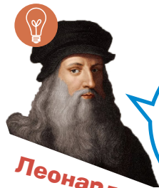
Леонардо да Вінчі

1 Прочитайте. Який вислів вам сподобався найбільше?