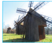
Музей народної архітектури та побуту (с. Пирогів)