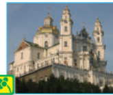
Свято-Успенська Почаївська лавра

Художній образ — це відображення реальності крізь призму світосприйняття мистця, його естетичних поглядів і ставлення до життя. Тобто, живописець, графік, скульптор творчо переосмислює дійсність і, використовуючи художню мову, способи зображення та засоби виразності того чи іншого виду образотворчого мистецтва, передає свої думки, враження й переживання у художньому творі.