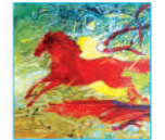
А. Боднар. «Воля»