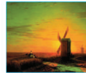
І. Айвазовський. «Вітряки в українському степу при заході сонця»