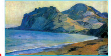
П. Корін. «Коктебель»