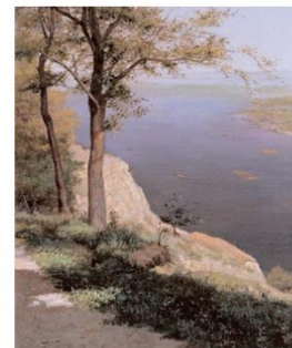
М. Мурашко. Вид на Дніпро