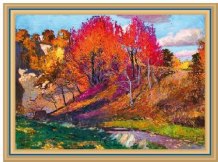
Й. Бокшай. Золота осінь

Восени багато птахів відлітає до ... країв, у вирій. ... зозулі, ... солов'ї, ... ластівки зникають, ледве відчувши першу прохолоду ... ночей. А жайворонки, шпаки іноді тримаються ще й тоді, коли вже на ... луках з'являється ... паморозь. У ... краях наші птахи ні пісень не співають, ні гніздечок не в'ють. Тільки чекають, коли минуться ... холоди і можна буде повернутись у ... край (За О. Копиленком).