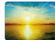
Т. Степанюк. Озеро Світаязь

Художниця. Їй небо — полотно, І сонце єрає в барвах на мольберті, Нуртує* , мов живе, у круговерті, І сйяву пригасає не дано.