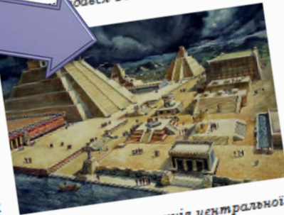
Сучасна реконструкція центральної площі Теночтітлану