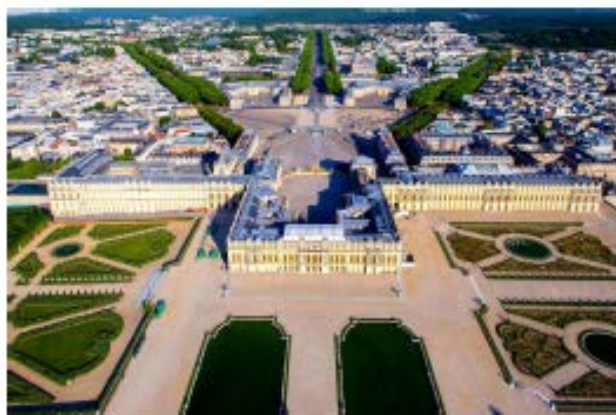
Версальський палац (сучасний вигляд)