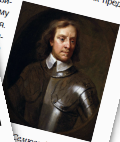
Семюел Купер «Портрет Олівера Кромвеля», 1655 р.