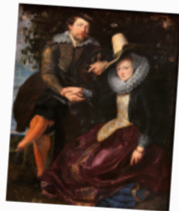
Пітер Пауль Рубенс «Автопортрет з Ізабеллою Брант», 1609 р. Ізабелла була дружиною Рубенса

... (1577–1640) був центральною фігурою нідерландського мистецтва XVII ст. Спільною рисою його мистецтва з нідерландським мистецтвом в усьому його прояві є інтерес до побутових деталей. Рембрандтських майстрів притягували портрети бюргерів і міщан, тоді як венеційські майстри зображали те, що влаштовувало церкву.