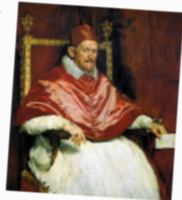
Дієго Веласкес. Портрет папи Інокентія X, 1650 р.

...рцою Рубенса, адже він був іспанського намісника у Фландрії. Він відзначився не тільки знанням мови, але й талантом, який давав йому можливість в яскравих фарбах передавати почуттів і вчинків. Рубенс був талановитим художником, який справляв величезне враження на глядачів. Він був одним з найбільш видатних живописців XVII століття. Як сказав Рубенс? Як сказав Рубенс? Як сказав Рубенс?