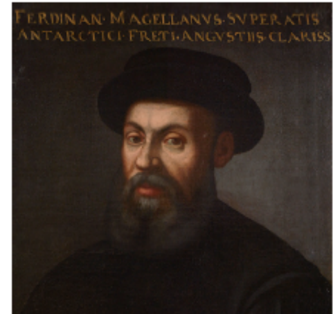
Невідомий художник. Портрет Фернана Магеллана, близько 1480–1521 рр.

Додаткова інформація в електронному додатку