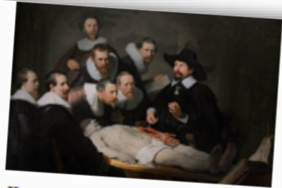
Це груповий портрет доктора Тульпа та його учнів. Тут Рембрандт уперше відмовився від традиційної композиції, де всі персонажі стоять одна біля одної. Ця картина зробила художника відомим