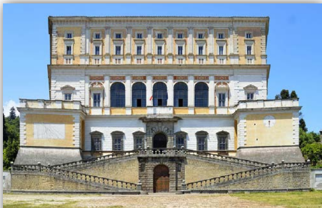
Вілла Фарнезе, XV ст. Сучасний вигляд