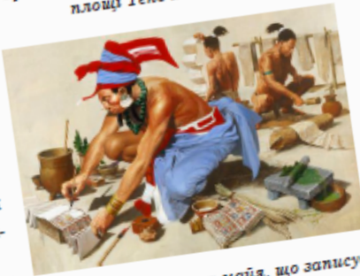
Сучасне зображення майя, що записує кольоровими чорнилами книгу

...іспанського короля Філіпа IV. Іспанська аристократія не вимагала, щоб її малювали красивіше, ніж вона була насправді, — вона пишлася