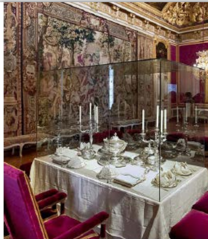
Нині Версаль є музеєм, у якому реконструйовано вигляд кімнат таким, яким він був за Луї XIV