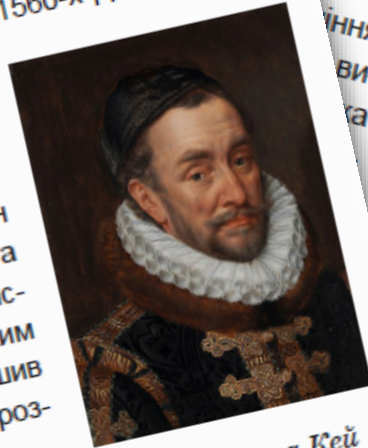
Адріан Тома Кей «Портрет Вільгельма I Оранського», 1579 р.

Олівер походив із аристократичної родини, вивчав право у Лондоні, був членом Палати громад, ставником Кембриджського університету, організатором протестантської реформи.