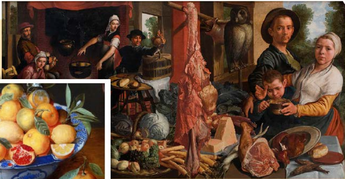
Пітер Артсен «Багата кухня», 1570 р.