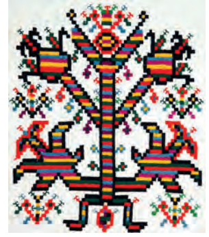
Зображення Світового Дерева на українському рушнику

Дуб-дуб-довговік, На ньому дванадцять гіллів, На кожній гілці по чотири гнізда, А у кожному гнізді по сім яець, І кожному ім'я є.