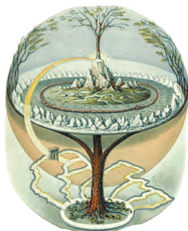
Образ Світового Дерева (Скандинавія)

Всевидяче Око пронизало своїм могутнім променем бездонне і темне Нащадо — і раптом пустило сльозу. З тієї кришталевої чистоти народився птах на ім'я Сокіл — посланець Божий. Його священний Дух осяяв темряву, аби засіяти у ній Свідомість та Буття.