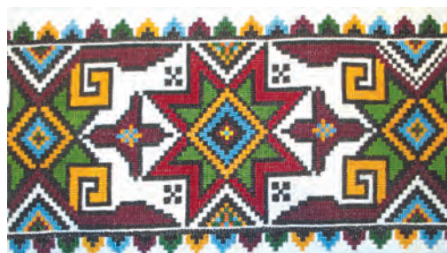
Зображення зірки Алатар на українському вишиваному рушнику

Тоді Первоптах Сокіл зніс золоте яйце і кинув його у створений простір. З того яйця народився Благом подарований Вирій-Рай, посеред якого стало рости Дерево Життя.