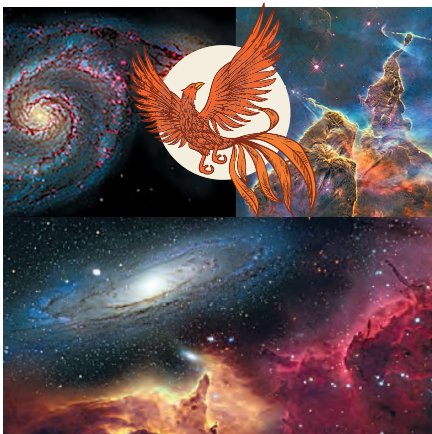
Фото космосу з телескопа «Габбл»

А наша тема — таємниці зародження світу і людини. Про це з цікавістю слухали діти на всіх континентах світу: в Америці, Австралії, Африці, Європі та Китаї. Сюжети давніх міфів і казок дивовижно схожі: були Володарі Неба, які думками (чи «радонькою» — як співається в українських колядках) вирішили створити Світ.