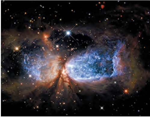
Фото космосу з телескопа «Габбл»