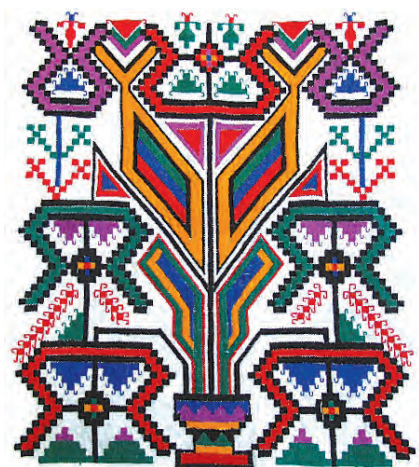
Світове Дерево на українському рушнику