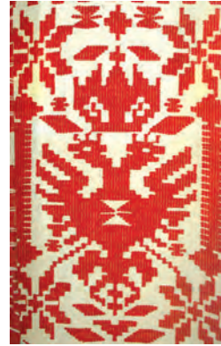
Зображення Сокола-Рода із зіркою Алатар та світобудовною «церковцею» на українському тканому рушнику