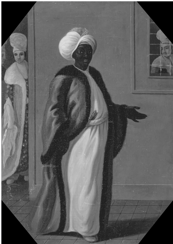
Кизляр-ага султанського гарему. Ф. Сміт. XVIII ст. Ельський центр британського мистецтва (США)

розпеченим залізом або заливали смолою, у канал для виведення сечі вставляли бамбукову трубочку. Потім дитину на кілька днів закопували по шию в гарячий пісок.