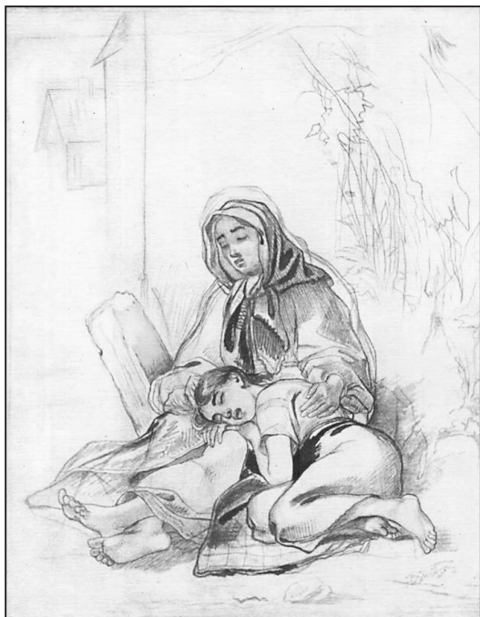
Т.Г. Шевченко «Слепая»