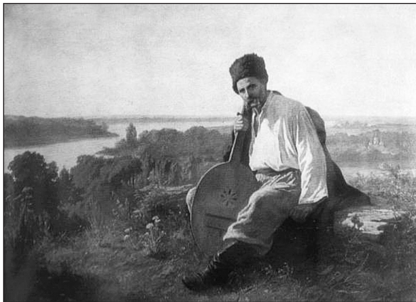
К.О. Трутовський «Шевченко з кобзою над Дніпром»