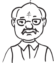
der Großvater 72

1. (6 балів) Напиши, скільки кому років.