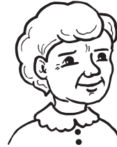
die Großmutter 86