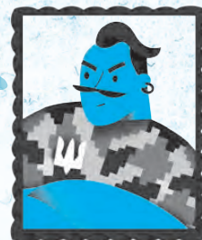
Незгамовний дух бібліотеки Бука

Я — дух бібліотеки Бука. Май на увазі: моє ім'я офіційно пишеться на англійський манер «Book-A». Та менше з тим! У житті головне не ім'я, а бути у центрі подій! Обожаю всілякі «активності», «екологічність» і дискусії, а ще впертюхів, які шукають відповіді та твердо стоять на своєму.