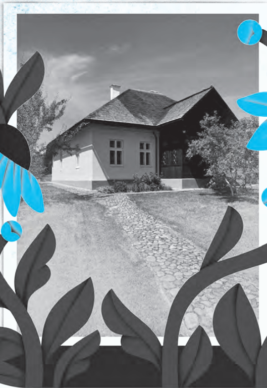
Будинок у Старому Угринові, де Степан Бандера народився і провів перші 10 років життя