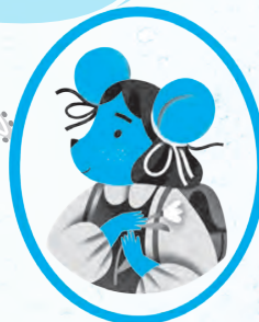
Комп'ютерна мишка Дока

На «Докійко!» я точно не озвуся! Втямив?!!