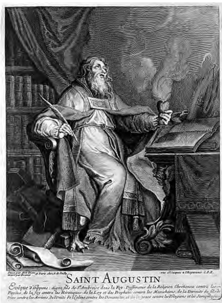
■ Святий Августин. Гравюра Мішеля Досьє.

На послуги Тобі хай буде присвячене все корисне, чого я навчився у хлоп'ячому віці; чи я говорю, пишу, читаю, чи лічу, усе те нехай служить Тобі, бо в той час, коли я вчився марних речей, Ти суворо карав мене; Ти простив мені всі грішні радощі, яких я навчився в тих марних речах. Правда, я навчився там багатьох корисних слів, але ж їх можна було навчитися також і в менш пустих речах, і цей шлях певний, і ним повинні йти діти.