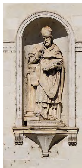
■ Статуя Августина Блаженного на фасаді церкви Сент-Етьєн, Ренн, Франція.

(Розмірковування на «Послання до Парфян», VII, 8)