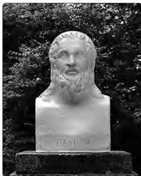
Погруддя Платона в Національному дендрологічному парку «Софіївка» в Умані. (деталь) (2016 р.)

Книжечка входить до серії «Дуже коротке введення», започаткованої видавництвом Оксфордського університету в 1995 р. для стислого й фахового ознайомлення з найрізноманітнішими аспектами духовної культури — від історії та міфології стародавнього Єгипту й античної Греції до сучасних політологічних, культурологічних, фізичних та космологічних теорій.