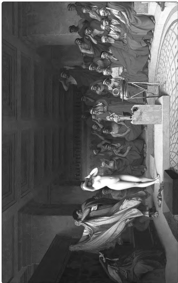
Жан-Леон Жером (1824–1904). Гетера Фріна перед судом присяжних (бл. 1861 р.). 1