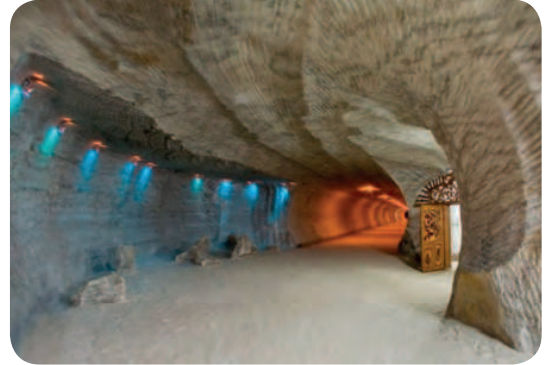
Соляна шахта в Солотвино.

Давним-давно сіль випарювали з морської води чи збирали з дна солоних озер. Тепер її добувають у глибоких шахтах. У ході видобування утворюються величезні коридори та просторі зали. В одній такій залі обладнали цілий собор, у другій — концертний зал. Вогні так красиво виграють на соляних стінах, що обидві споруди мерехтять, наче кришталеві.