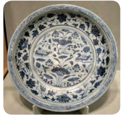
Таріль, династія Юань. 14 ст. Галерея мистецтв Фрір, Вашингтон

Порцеляну винайшли в Китаї в 620 р. У Європі її навчилися виробляти лише через 1100 років. Європа — світ не близький. Порцеляну доводилося довго везти або кораблями, або верблюдами через пустелю. Не дивно, що вона була дорожча, ніж золото. Навіть уламки від побитого в дорозі посуду обрамляли як картини й оздоблювали ними стіни будинків.