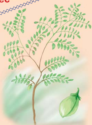
Нут (баранячий горох)