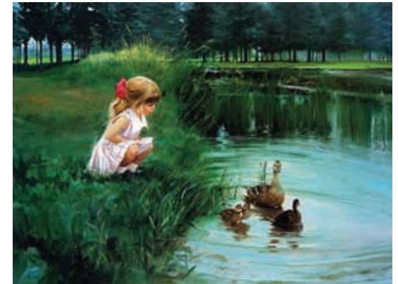
Д. Золан. «Біля річки»