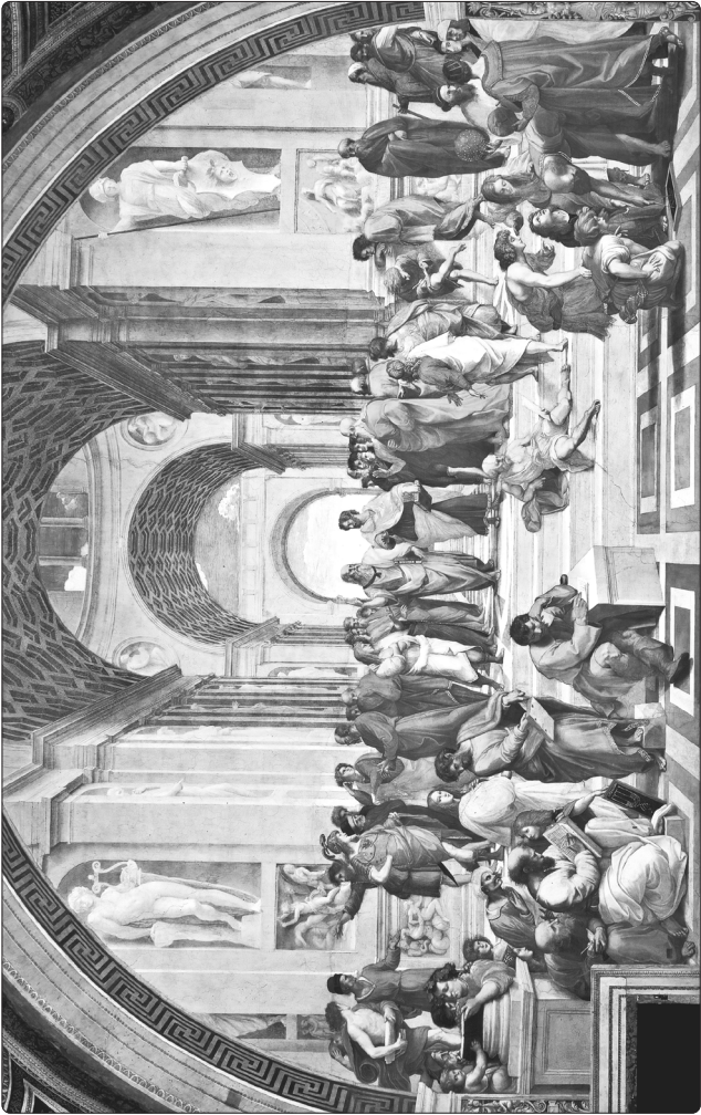
Рафаель Санті. Афіньська школа. Ватиканський палац (1511 р.)