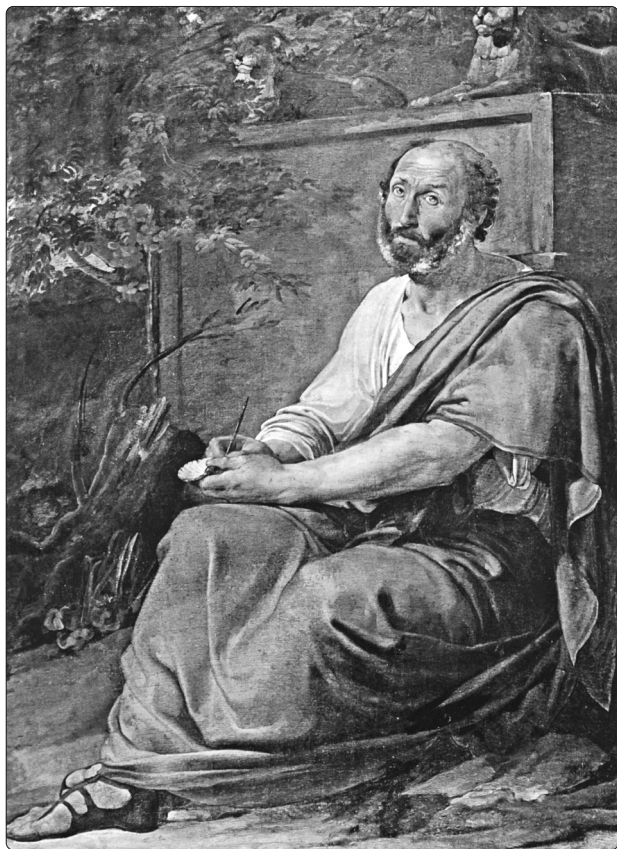
Франческо Аец. Аристотель (1811 р.) Венеція. Галерея Академії