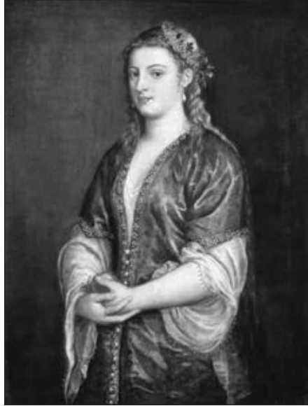
Портрет леді (Роксолани). В. Тіціан. 1555 р. Samuel Kress Collection, Courtesy of the National Gallery of Art, Вашингтон, США

Її листи почали «дихати» квітучою, барвистою мовою, якою вона щебетала, немов соловейко, не лише про кохання, а й про релігійні та політичні справи 38 . Так, не раз у листах Хюррем, називаючи прекрасним лице султана, згадувала Юсуфа, який, за коранічними текстами, вирізнявся від інших людей надзвичайною красою 39 . У збірнику хадисів Мусліма йдеться про те, як пророк Магомет під час сходження на небеса дарував йому половину краси Адама, якого Аллах створив Своєю рукою, і надав йому найдосконалішого й найпрекраснішого вигляду. Від пророка Юсуфа божеволіли жінки, і він, щоб їх не спокушати, був змушений прикривати своє прекрасне обличчя накидкою. Проте одна жінка: дружина намісника фараона – у Корані, Потифара або ж Пентефрія – у Біблії виявилася наполегливішою у своїх домаганнях. Вона намагалася його звабити, однак той опирався спокусі. Розгнівана жінка звела на юнака наклеп, звинувативши його у спробі згвалтування. Її задум спершу мав успіх: Юсуфа засудили та ув'язнили. Згодом фараон виправдав невинуватого чоловіка, наділивши його за всі заслуги державною владою.