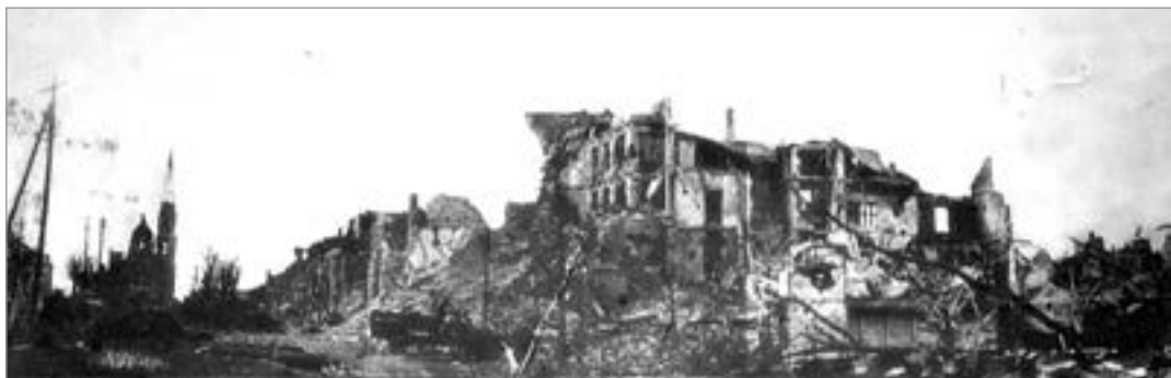
Руїни на вул. Міцкевича. Зліва — Парафіяльний костел. Вид з півдня. Травень 1944 р.

На початку травня відновив свою діяльність обласний драматичний театр імені І. Франка під керівництвом режисера Миколи Коморовського. Актори давали «шефські» концерти для червоноармійців. Особливим успіхом користувалися російські ліричні пісні та гумористичні мініатюри. Художник театру, випускник Варшавської Академії Красних Мистецтв Олекса Шатківський, малював для армійських клубів портрети радянських полководців, лозунги, плакати, оголошення. 22 травня колектив театру виїхав на чотиримісячні гастролі до Кременця, Почаєва та Вишнівця. Від жовтня 1944-го до травня 1945-го театр працював у Чорткові.