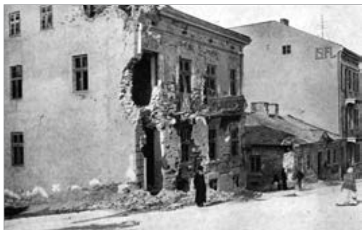
Руїни будинку. 1944 р.