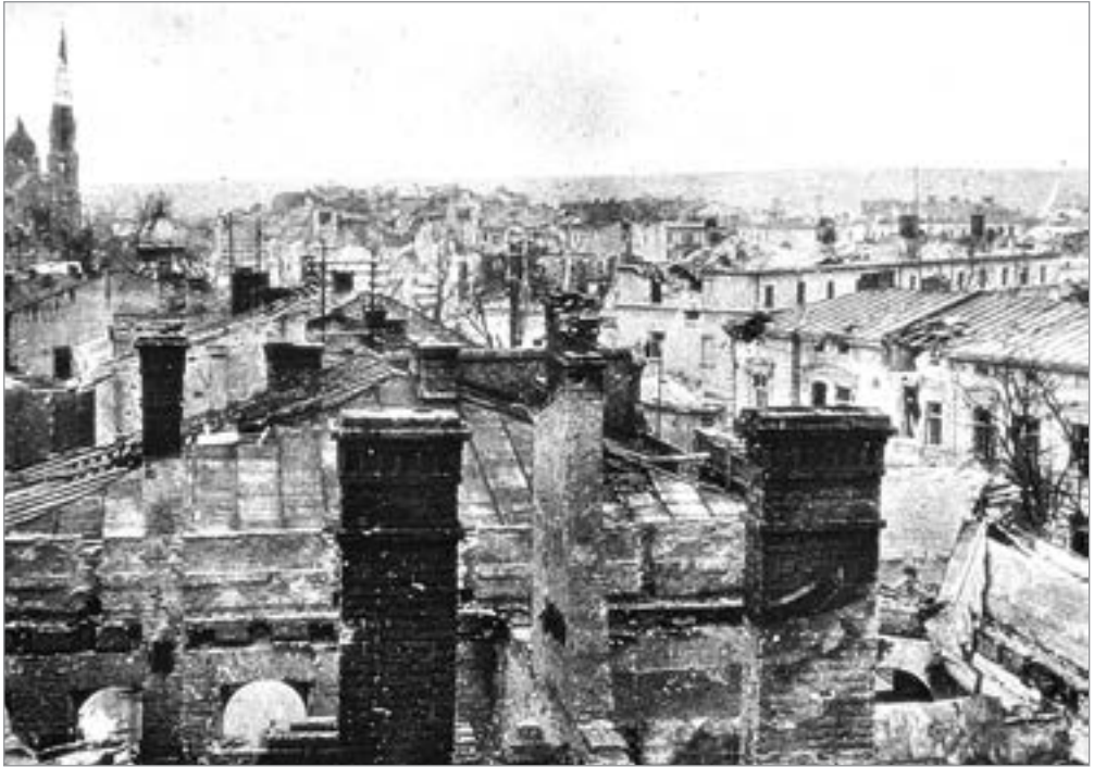
Дахи будинків на вул. Тарновського. Зліва — Парафіяльний костел. Вид зі сходу. Травень 1944 р.

лодь Тернопільщини» — 4, «Селянин Тернопільщини» — 13, селяни с. Цеценівка (район Великі Дедеркали) — 1 танк. Бойові машини з відповідними написами на баштах делегація області передала Червоній Армії наприкінці червня в районі Смигла-Дубно. На фронт були мобілізовані всі чоловіки віком від 18 до 50 років без належної військової підготовки: українців зараховували до Червоної Армії, поляків — до Війська Польського.