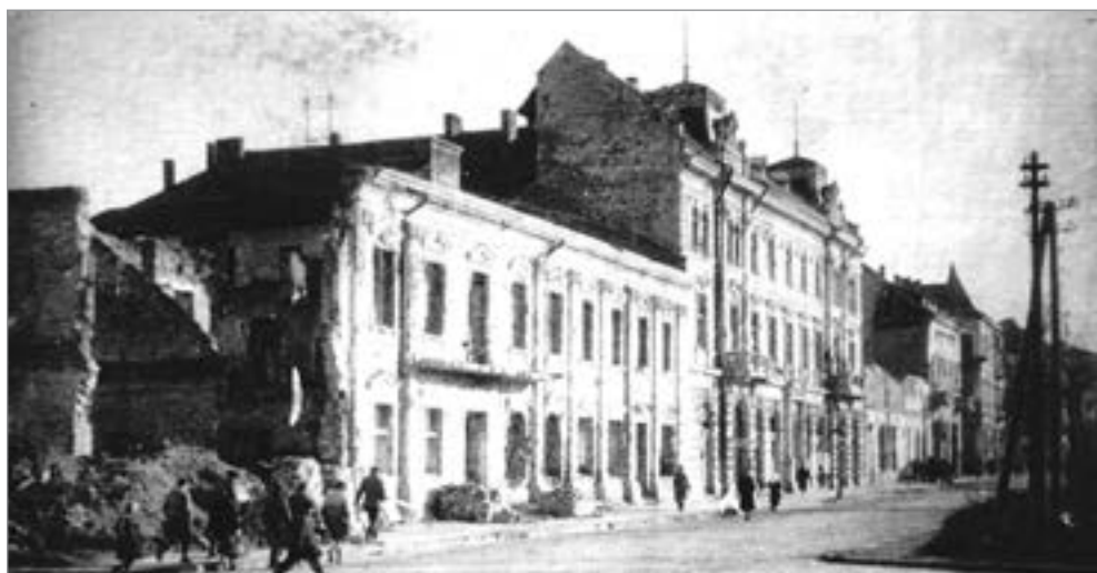
Руїни міської ратуші й готелю «Подільський». 1944 р.