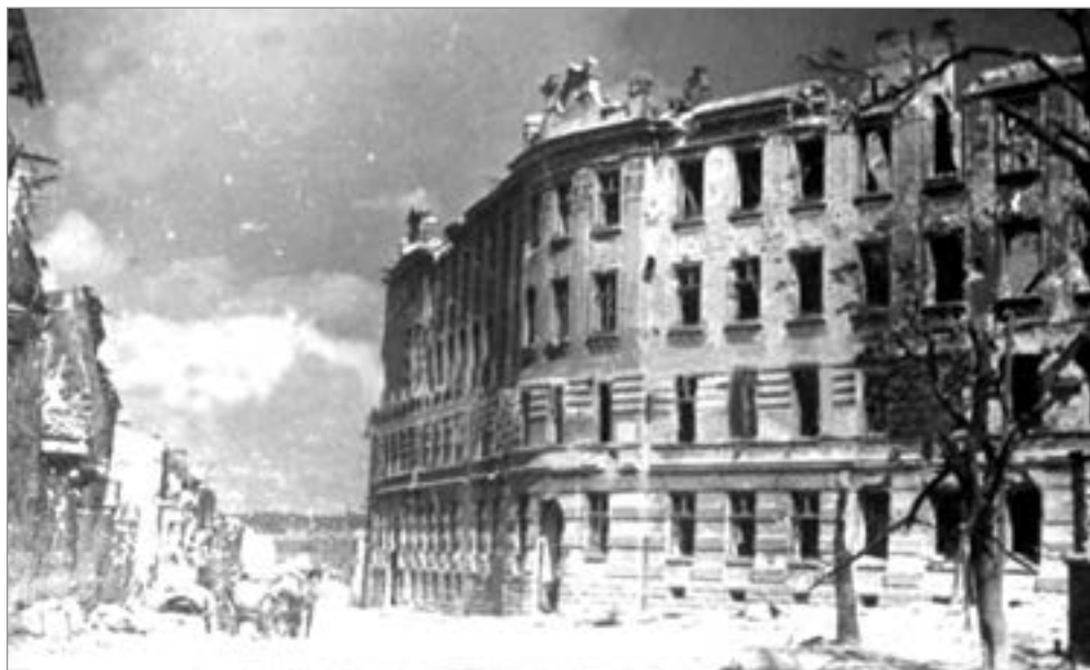
Зруйнований будинок 2-ої польської гімназії (тепер СШ № 4). 1944 р.

Символом-взірцем для наслідування пропонували 13-літнього Павлика Морозова, який доніс органам НКВД на батька — голову сільради, а також дядька, рідного діда, своїх сусідів як «ворогів народу», за що й був убитий.