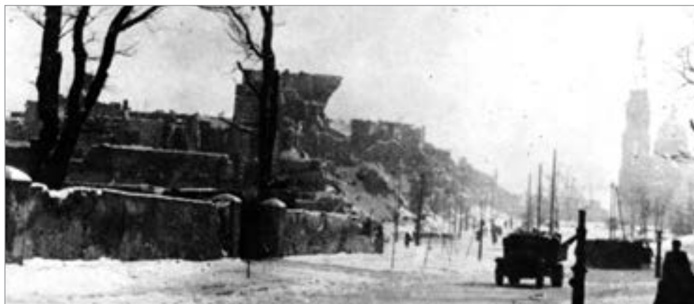
Зруйнований центр міста. Вул. Міцкевіча. Грудень 1944 р.