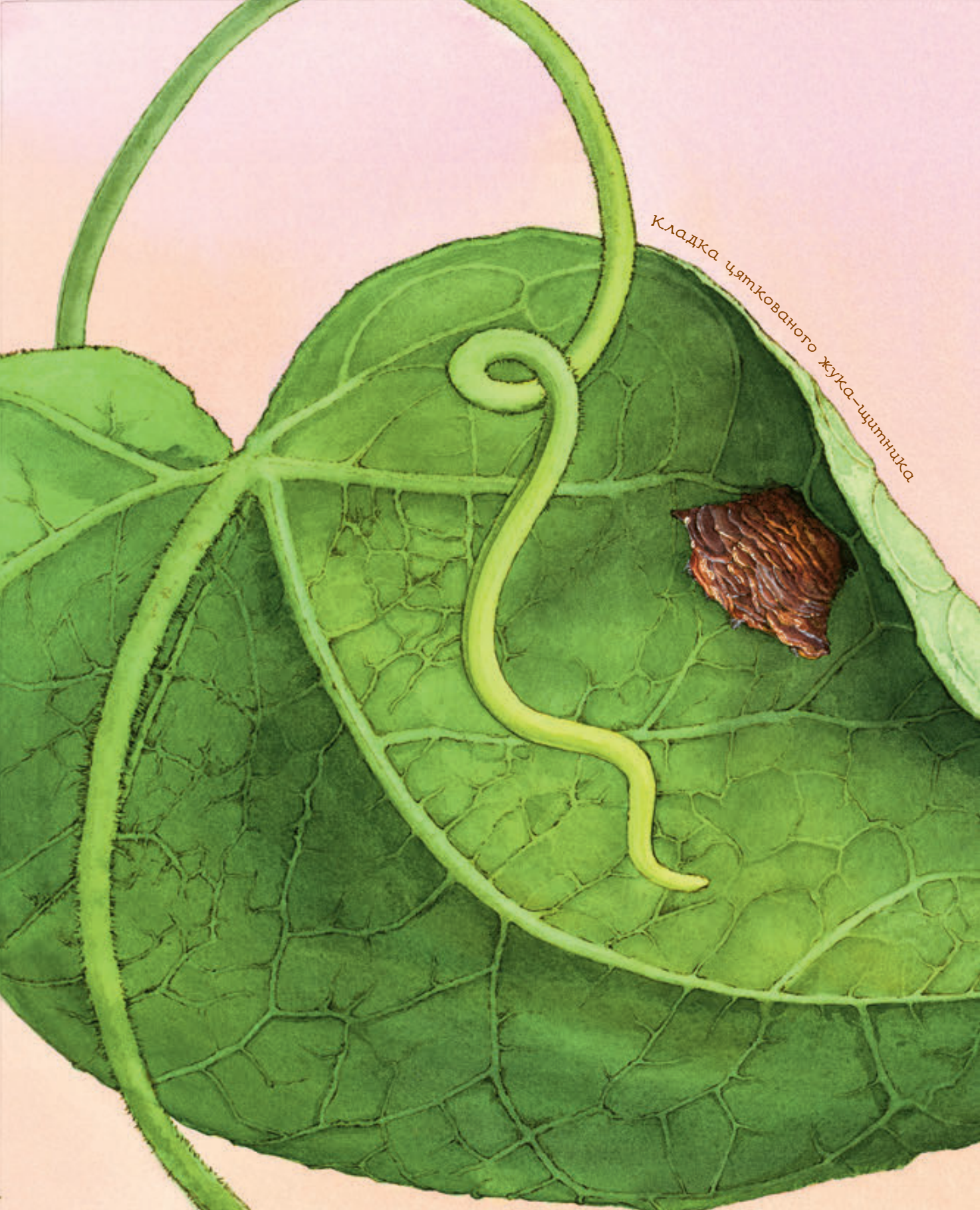
Кладка цяткованого жука-щитника