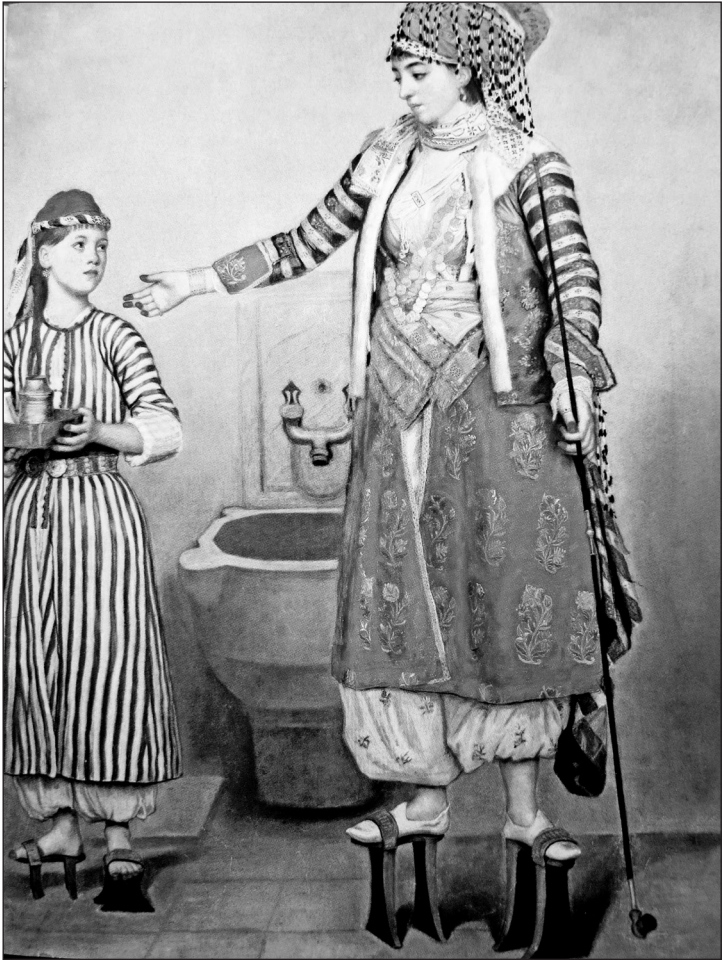
Ж.Е. Ліотар. «Османська жінка та рабня у хамамі»

Надійка злякалася, що впаде, взувши такі одоробла. Вона обережно встромила ноги в дивні черевики й одразу ж стала на півголови вищою.