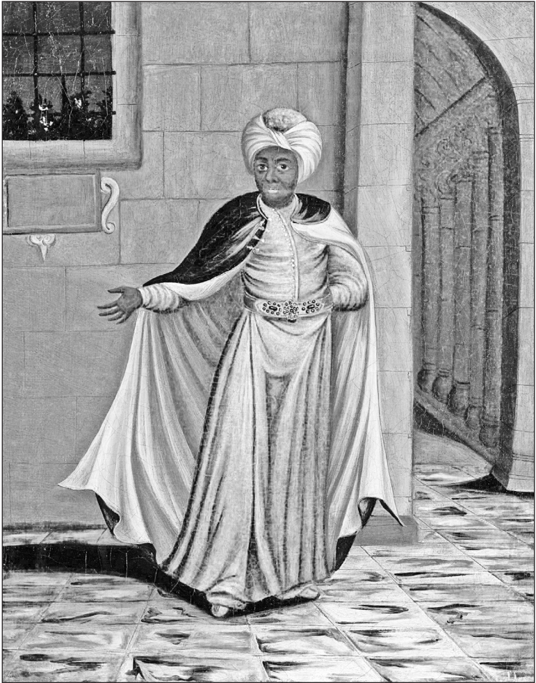
Ж.Б. Ван Мур. «Головний чорношкірий євнух гарему»