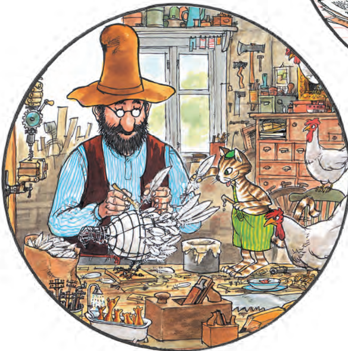
Працювати в майстерні о третій годині дня