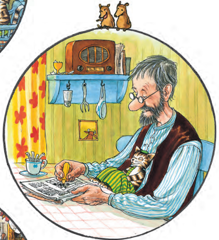
Розгадувати кросворд об одинадцятій годині