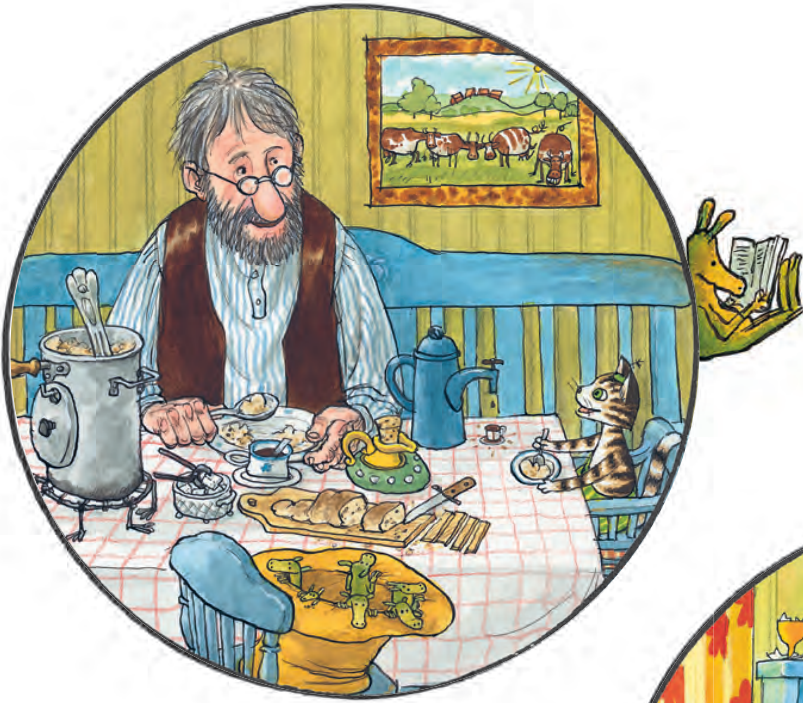
Снідати о восьмій годині