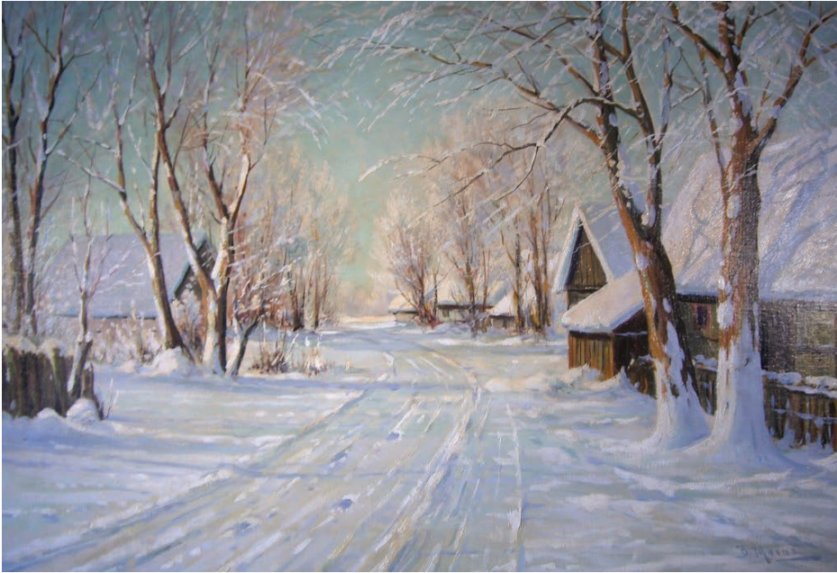
Репродукція картини В. Мораса «Зимовий пейзаж»