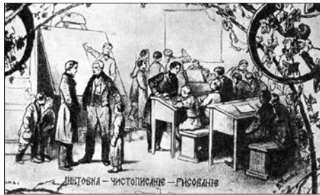
137. Недільна школа

З ініціативи передових українських інтелігентів відкривалися недільні школи, «де можна було вчитися вечорами та неділями робітникам та слугам неписьменним». Перша з них заснована в Полтаві (1858 р.) для хлопців та дорослих чоловіків від 6-8 до 50 років.