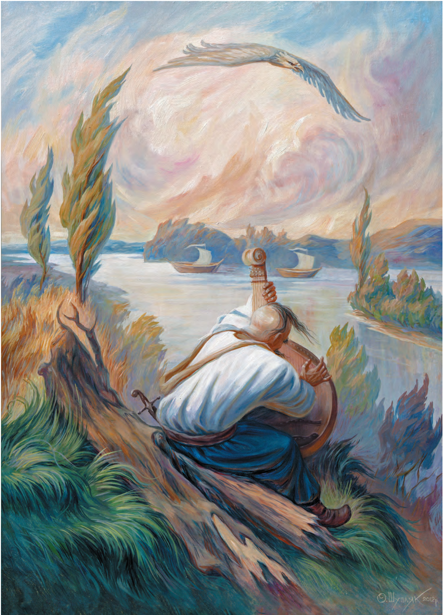
Дух свободы. Тарас Шевченко. 2012