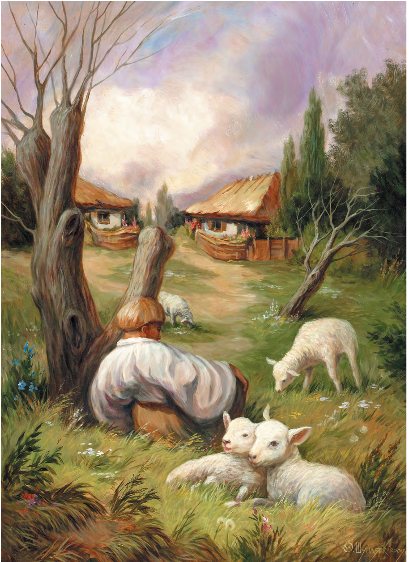
«Мені тринадцятий минало...». Тарас Шевченко. 2009

“As I was passing the thirteenth year ...”. Taras Shevchenko