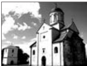
Церква Святого Пантелеймона поблизу Галича