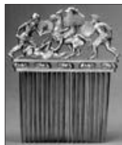
Золотий гребінь з кургану Солоха