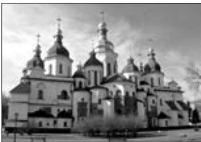
Софійський собор в Києві

980–1015 рр. — правління князя Володимира Святославича.