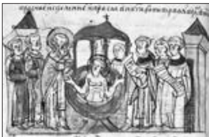
Хрещення Русі великим князем Володимиром. Мініатюра з Радзивилівського літопису