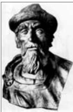
Ярослав Мудрий. Реконструкція М. Герасимова