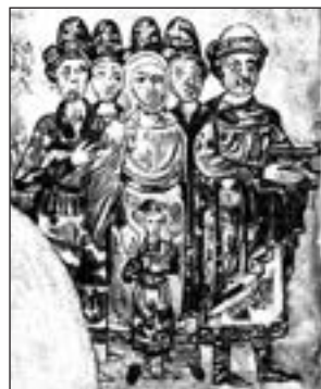
Князь Святослава Ярославич з сім'єю. Мініатюра в «Ізборнику»

1125–1132 рр. — правління київського князя Мстислава Великого.