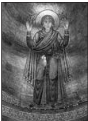
Богоматір Оранта (мозаїчний образ з собору Київської Софії)