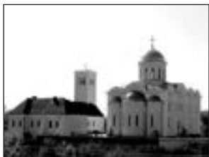
Свято-Успенський кафедральний собор — Володимир-Волинський