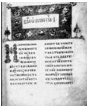
Сторінка з Остромирового Євангелія