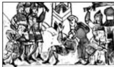
Князівські міжусобиця. Мініатюра з літопису