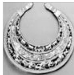
Золота пектораль з кургану Товста Могила

Цеглина з Десятинної церкви зі знаком князя Володимир