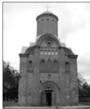
П'ятницька церква (Чернівці).

1056–1057 рр. — створення Остромирового Євангелія.