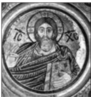
Христос Вседержитель. Софійський собор