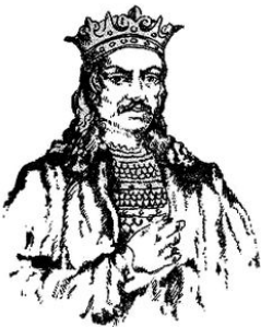
Юрій II Болеслав

Ось що писав 20 жовтня 1335 року великий галицько-волинський князь Юрій II (Болеслав) генеральному магістру Тевтонського ордену Теодоріку: «В ім'я Господнє, амінь.