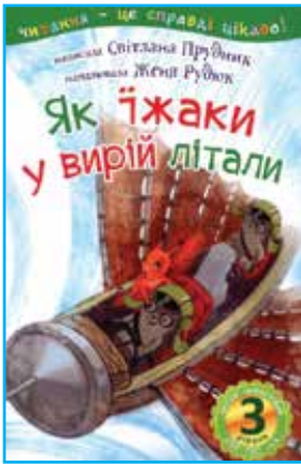
Є. Рудюк. Обкладинка до книжки