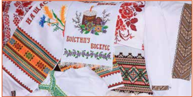
Д. Крупа. Вишивка