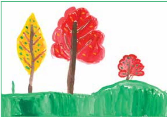
Дитячий малюнок (А. Левчук)