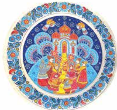
Г. Назаренко. «Різдво» (тарілка)