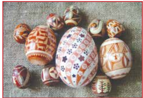
Р. Крамар. Дряпанки