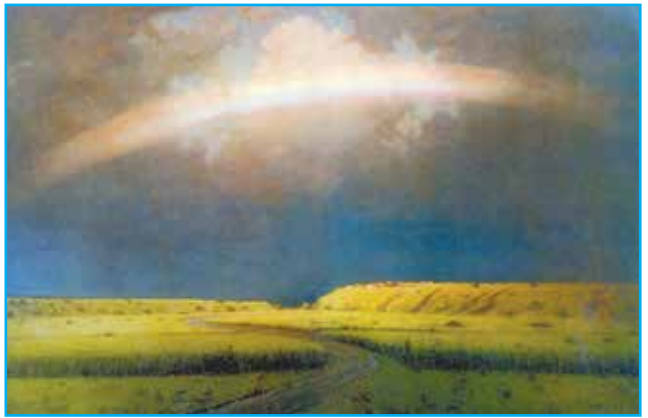
А. Куїнджі. «Веселка»