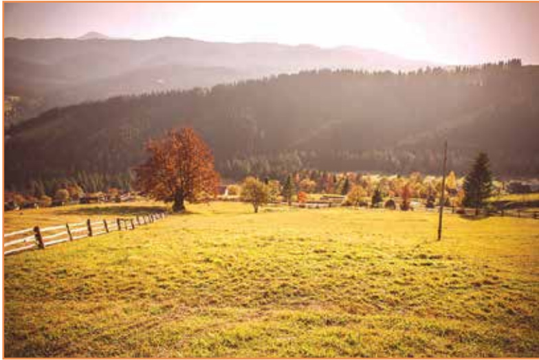
О. Максимлюк. «Карпатський краєвид»

Назви кольори, якими можна намалювати ілюстрацію до цієї музики.