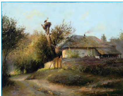
Р. Середюк. «Лелека»

Письменники змальовують її словами, композитори оспівують у музиці. А художники передають красу природи на своїх картинах.