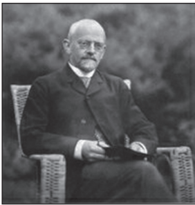
Давид Гільберт (1862 – 1943)

творець української математичної термінології, наукові дослідження стосуються теорії рівнянь, кінчних перерізів та конгруенцій.