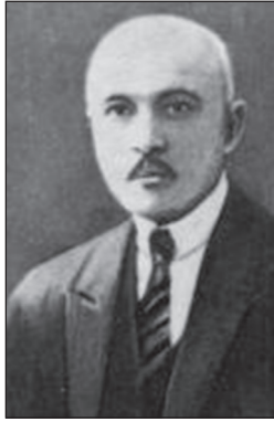
Володимир Левицький (1872 – 1956)

один із перших авторів шкільних підручників з математики та фізики, написаних українською мовою.