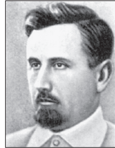
Михайло Кравчук (1892 – 1942)

доктор філософії, професор математики в Белгородському університеті (за походженням українець), член Сербської і член-кореспондент Хорватської академії наук, автор близько 400 наукових праць, які систематизовані в 19 книгах.