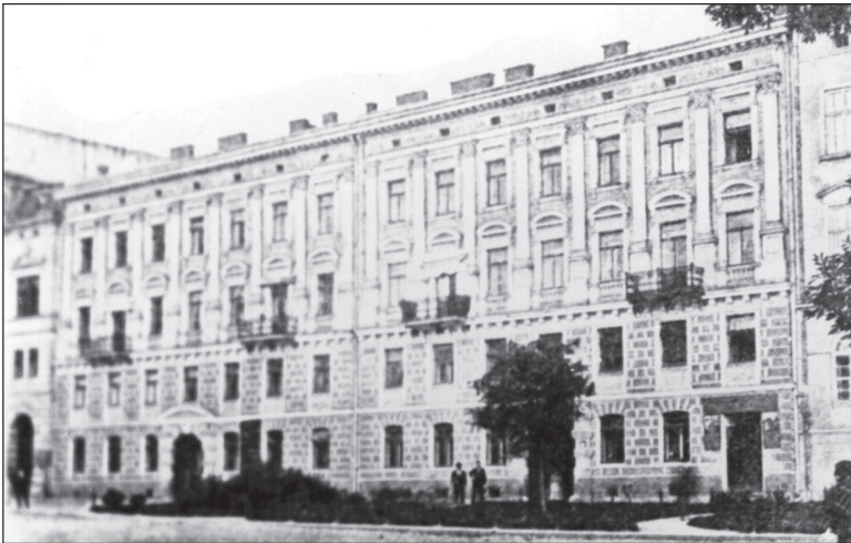
Дім Наукового товариства ім. Шевченка

Щоб розгорнути українську наукову роботу, яка в Східній і Центральній Україні була загальмована після Емського указу 1876 р. і дальших заборон та обмежень російського самодержавства, О. Кониський і В. Антонович реорганізують літературне Товариство ім. Шевченка (1893 р.) у Наукове товариство ім. Шевченка (НТШ). Ця реорганізація була здійснена за зразками західноєвропейських наукових установ і з метою стати засновником майбутньої українсько-руської академії наук. У складі НТШ створюється три секції: філологічна, історико-філософська та математично-природописно-лікарська.