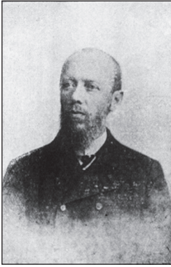
Петро Огоновський (1853 – 1917)

один із перших авторів шкільних підручників з математики та фізики, написаних українською мовою.