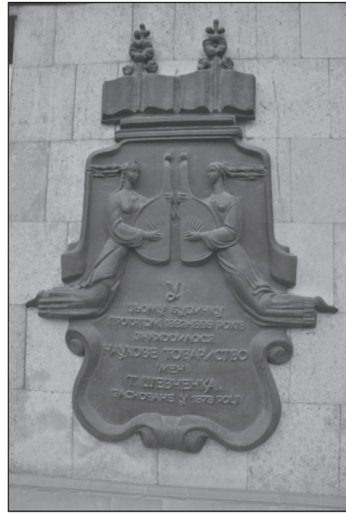
Меморіальна дошка на будинку в м. Львів, де знаходилося НТШ у 1892 — 1898 рр.

Піонерською для української науки була діяльність математично-природописно-лікарської секції (МПЛС), яку очолювали І. Верхратський, а пізніше В. Левицький. В українській науці засвоєними були вже такі розділи, як ботаніка, зоологія, географія і частково медицина. Новими ділянками досліджень, які проводились у МПЛС, були математика,