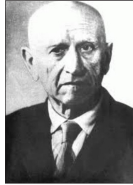
Микола Чайковський (1887 – 1970)

дослідник теорії аналітичних функцій. Займався також геометрією, алгеброю, диференціальними рівняннями та історією математики.