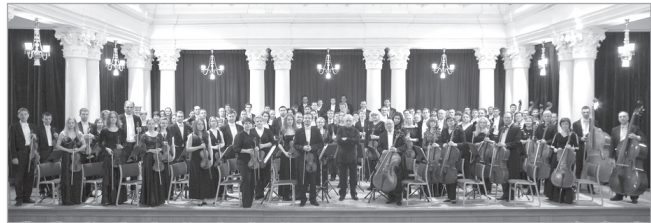
Академічний симфонічний оркестр Національної філармонії України