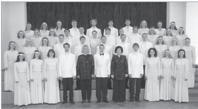
Молодіжний хор «Світич» Ніжинського державного університету імені Миколи Гоголя

Народна музика — це традиційна музика народів та регіонів. Її створюють і передають в усній формі від виконавця до виконавця, від покоління до покоління. До народної музики належать народні пісні, інструментальні твори та музика до танців. Професійна музика — це музика, створена композиторами. Вона написана в певному жанрі, музичній формі, має свої засоби виразності та втілює задумані авторами музичні образи. Засобами виразності музики є мелодія, гармонія, лад, ритм, темп, тембр, діапазон, регістр, динаміка, інтонація тощо.