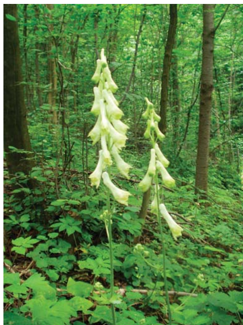
Фото Я.І. Капелюха (2004 р.)