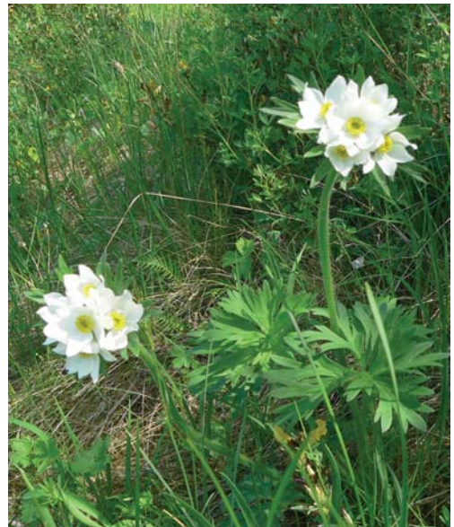
Фото В.М. Черняка (2007 р.)

Джерела інформації. [10; 26; 52; 72; 75; 82; 151; 152; 153; 159].