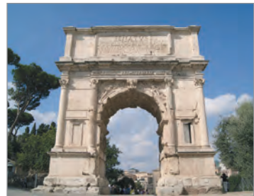
Тріумфальна арка Тита. I ст. Рим