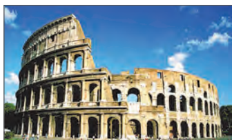
Колізей. I ст. Рим