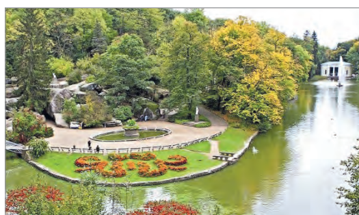
Національний дендрологічний парк «Софіївка». 1796–1802 рр. Умань

Предметами зображення в мистецтві є природні об'єкти, внутрішній світ людини, її почуття, важливі для неї події особистого чи суспільного життя, побут, традиції тощо, а специфічною формою відображення дійсності — художній образ , який виявляє загальне через конкретне, індивідуальне. Тобто митець/мисткиня творчо переосмислює дійсність і, використовуючи художню мову, способи зображення та засоби виразності того чи іншого виду мистецтва, передає свої думки, враження й переживання в художньому творі.