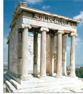
Храм Ніки Аптерос. V ст. до н. е.