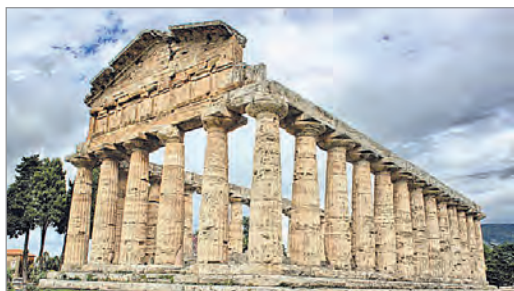
Храм богині Гери в Пестумі. V ст. до н. е.

Із плином часу пропорції змінюються: колони стають стрункішими, відстані між ними збільшуються, а капітелі зменшуються. Завдяки цьому споруди здаються легшими, ніби наповненими світлом і повітрям. Саме такі враження викликає головний храм афінського Акрополя — біломармуровий Парфенон — храм Афіни Парфенос (Діви). Секрет цієї будівлі, у якій вдало поєднані доричний та іонічний ордери, криється у винятковій ритмічності та пропорційності частин. Храм, споруджений давньогрецькими зодчими Іктином і Каллікратом у V ст. до н. е., вражає донині. Цікаво, що мрамур, з якого побудовано Парфенон, може змінювати свій колір від сніжно-білого до насичено бежевого — залежно від погоди, пори року й навіть частини доби.