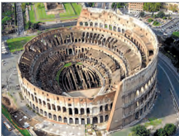
Колізей. I ст. Рим

Найвизначнішою пам'яткою давньоримської архітектури, що збереглася до наших днів, є Колізей , або амфітеатр Флавіїв (I ст. н. е.).