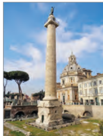
Колона Траяна. II ст. Рим