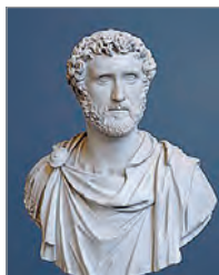
Бюст римського імператора Антоніна Пія. Бл. 140 р. Мармур