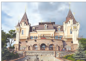
В. Юдін. Будівля Київського академічного театру ляльок. 2005 р.

Розгляньте ілюстрації. Які види мистецтва на них зображено? Обґрунтуйте свою думку.