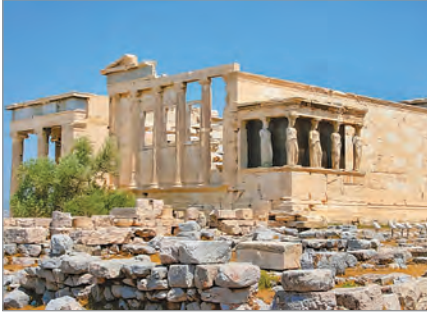
Храм Ерехтейон. V ст. до н. е.

польоту. Храм дуже постраждав від воєнних дій у різні епохи. Лише в 2000 р., використовуючи всі знайдені фрагменти, його вдалося ретельно відреставрувати.