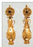
Золоті сережки. VI ст. до н. е.