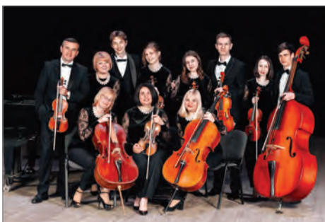
Муниципальний Галицький камерний оркестр. 1991 р.