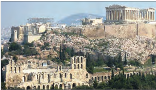
Афінський Акрополь. V ст. до н. е. Греція

Епоха класики — час високого злету культури, вагомих досягнень у науці, літературі, філософії, мистецтві. У цей період жили й творили видатні філософи Сократ , Платон та Арістотель , «батько історії» Геродот , засновник європейської медицини Гіппократ , талановиті скульптори Фідій , Мирон , Поліклет . Театральне мистецтво було представлене блискучим комедіографом Арістофаном та «безсмертною тріадою» трагіків — Есхілом , Софоклом , Евріпідом .