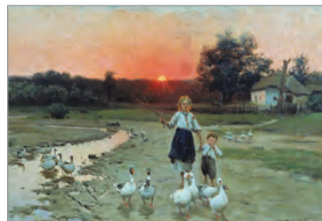
М. Пимоненко. «Вечоріє». 1900 р.