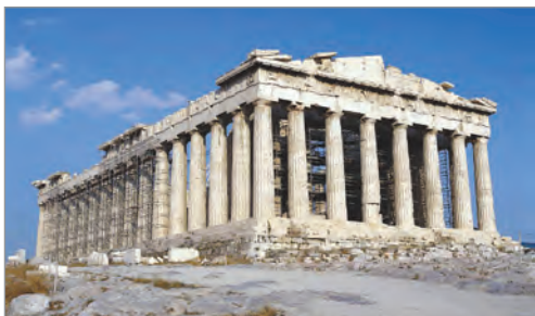
Парфенон — храм Афіни Парфенос. V ст. до н. е.

Архітектура ранніх грецьких храмів, до яких належать два храми богині Гери (серед. VI ст. до н. е. і серед. V ст. до н. е.) в Пестумі, вирізнялася масивністю, величною суворістю. Таке враження створювалось завдяки приземистим доричним колонам, розміщеним доволі близько одна від одної. Загальний вигляд цих монументальних споруд, строгі пропорції та чіткий ритм колонади підкреслювали велич міста-держави, непорушність суспільного порядку.