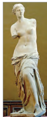
Венера Мілоська. II ст. до н. е.