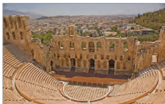
Одеон Ірода Аттичного. II ст. Афіни

Розгляньте ілюстрації. До яких видів мистецтва належать зображені шедеври античності? Порівняйте ці твори з матеріальними цінностями сучасної культури.