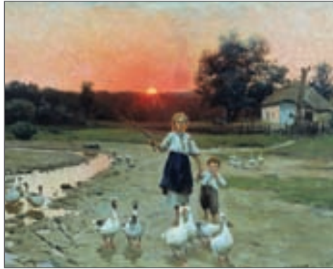
М. Пимоненко. «Вечоріє». 1900 р.