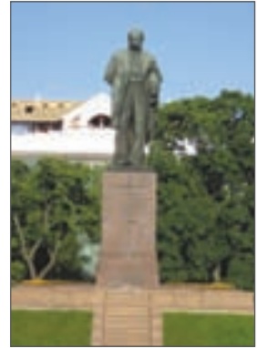
М. Манізер. Пам'ятник Т. Шевченку в Києві. 1939 р.