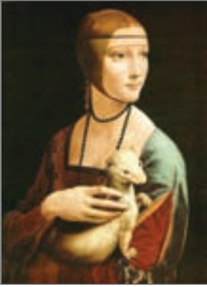
Леонардо да Вінчі. «Пані з горностаєм». XV ст.

Розгляньте репродукцію твору Леонардо да Вінчі «Пані з горностаєм». Охарактеризуйте індивідуальний стиль митця за питаннями.