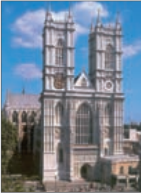
Вестмінстерське абатство. 1245–1745 рр. Лондон

Розгляньте ілюстрації. Які види мистецтва на них зображено? Обґрунтуйте свою думку.