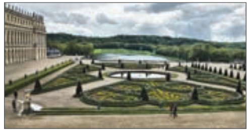
Версальський парк. XVII ст. Франція

Предметами зображення в мистецтві є природні об'єкти, внутрішній світ людини, її почуття, важливі для неї події особистого чи суспільного життя, побут, традиції тощо, а специфічною формою відображення дійсності — художній образ , який виявляє загальне через конкретне, індивідуальне. Тобто, митець творчо переосмислює дійсність і, використовуючи художню мову, способи зображення та засоби виразності