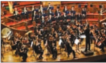
Лондонський симфонічний оркестр. Заснований 1904 р.