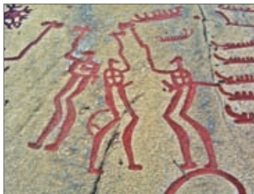
Ритуальний танок. Наскельний рельєф у Танумі. 1700–500 рр. до н. е. Швеція

Окрім цього, стародавні люди знаходили час для ритуальних співів і танців, основу яких складали рухи, що імітували поведінку тварин, мисливські та військові вправи. Подібні заняття для наших предків були водночас і магічним обрядом, і актом пізнання, і засобом передачі досвіду та згуртування колективу.