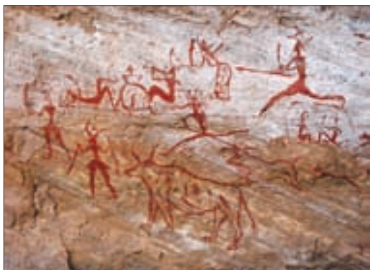
Наскельний малюнок у печері Шове. Бл. 30 тис. років до н. е. Франція

Мистецтво як особливий вид людської діяльності зародилося ще в добу палеоліту. Наші печерні предки, незважаючи на щоденну сувору боротьбу за виживання, захоплювалися красою довкілля, багатством та різноманітністю природних форм і намагалися відтворити їх у рисунках доступними засобами. Давні художники використовували гострі камінці для продряпування на скелях або вуглилки від вогнища, природні мінеральні фарби для контурних чи силуетних зображень тварин на стінах печер. Фарбу наносили пальцями або примітивними пензлями (жмут вовни, пучок трави). Пізніше в наскельних малюнках почали з'являтися зображення людей, багатофігурні композиції — зокрема, сцени полювання. Із глибини віків до нас дійшли й висічені з каменю скульптури тварин, рельєфи, гравюри на кістках і рогах упольованих звірів.