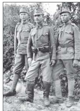
Українські січові стрільці. Поділля, 1916 р.

( За волю України: Історичний збірник УСС. 1914–1964 / За ред. С.Ріпецького. — Нью-Йорк: Червона Калина, 1967. — С. 418. )