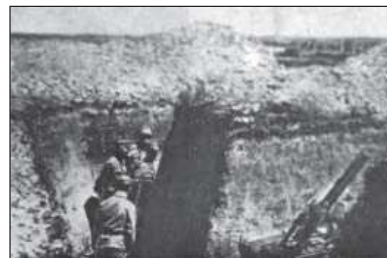
Міномет у стрілецьких окопах на позиції «Весела» на Теревовлянщині

2. Від дня 18-го вересня лучається вже другий случай підозріння про червінку. Заразки находяться в людських відходах, тому належить звертати