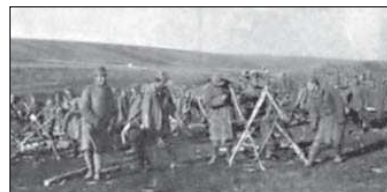
Легіон УСС над Стрипою

( За волю України: Історичний збірник УСС. 1914–1964 / За ред. С.Ріпецького. — Нью-Йорк: Червона Калина, 1967. — С. 417–418. )