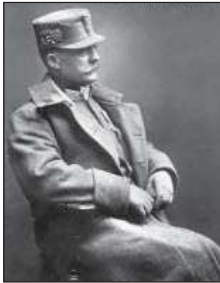
Отаман Мирон Тарнавський