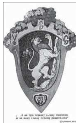
Поштова листівка, видана Пресовою кватирою УСС. Малюнок О. Новаківського, 1918 р.

Останні й досі не можуть забути січових лицарів та їх найбільшої «провини» — боротьби за самостійну Україну. Так, ще не встигло висохнути чорнило на Указі Президента України Віктора Юшенка «Про заходи з відзначення, всебічного вивчення та об'єктивного висвітлення діяльності Українських січових стрільців» від 6 січня 2010 р. 1 , як Москва, сполошившись, тут же вирішила повчати Україну історії. Традиційно не переймаючись такими «дрібницями», як втручання у внутрішні справи іншої держави, вона вустами спікера Держдуми Російської Федерації Бориса Гризлова заявила: «Це не перший недружній крок українського президента, який через політичну кон'юнктуру продовжує нав'язувати курс на перегляд спільної історії» 2 .