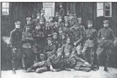
Учасники підстаршинських курсів у Розвадові Жидачівського пов.