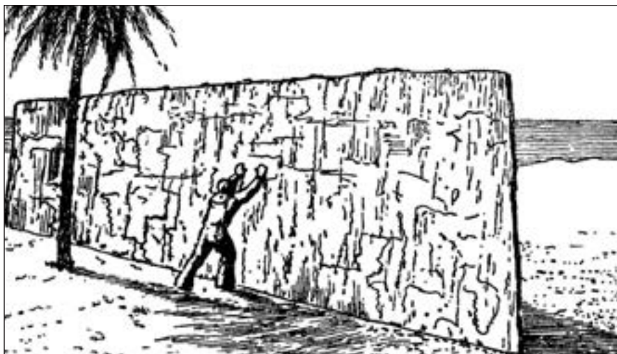
Рис. 3. Ось який справжній вигляд скелі в задачі Едісона

15 футів. Очевидно, вона дуже тонка. Прикиньмо, яка її товщина. Як відомо, об'єм визначається множенням довжини на ширину і на товщину. Отже, поділивши об'єм на довжину і на ширину, ми знайдемо товщину. Так і зробимо з об'ємом нашої скелі: поділимо 1 кубометр спочатку на 100 футів (тобто приблизно на 30 м), потім на 15 футів (приблизно на 5 м), а ще ліпше — одразу на 30 \times 5 , тобто на 150. Що ж вийде? — Всього \frac{1}{150} м, тобто близько 7 міліметрів.