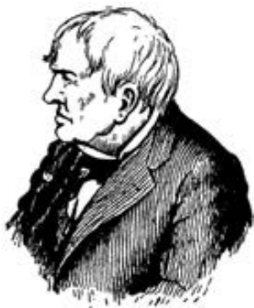
Рис. 1. Томас Едісон на схилі років. Він помер у 1931 р. 1

відомих американських педагогів. Одне з питань «вікторини» Едісона, яке я хочу запропонувати й вам, було таким: