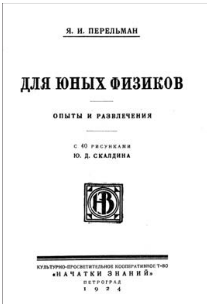
Титульна сторінка 1-го видання брошури «Для юних фізиків» — «першого наближення» до «Фізики на кожному кроці» (1924 р.)