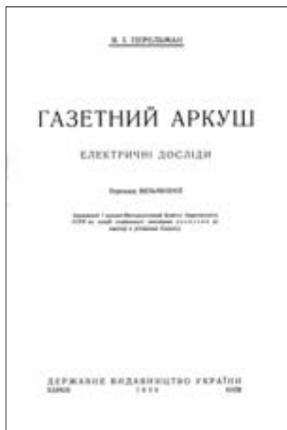
Титульні сторінки українських видань брошур «Молодим фізикам» та «Газетний аркуш» (1930 р.)

Оскільки масив рисунків з усіх першоджерел був надлишковим для основного тексту, то залишок було використано для віньєток на початок і закінчення розділів 1 . Така форма оздоби не раз застосовувалась у виданнях книг Я.І. Перельмана, тому ми вирішили вдатись до неї і тут (в оригіналі віньєток немає).