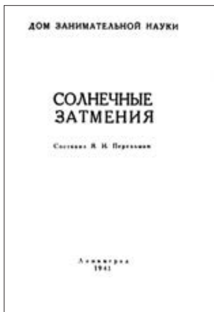
Обкладинка і титульна сторінка брошури «Сонячні затемнення» (1941 р.)

Нумерація рисунків наскрізна, однак за написом номера легко визначити, з якого саме джерела вони взяті. Основний масив рисунків узято з 2–3-го видань «Фізики на кожному кроці». Ці рисунки нумеруються звичайним шрифтом. Так само нумеруються й рисунки, взяті з брошури «Сонячні затемнення» (розділ 8). Номери рисунків з 1-го видання книги — курсивні. Рисунки із брошур-попередників нумеруються так: із брошури «Для юних фізиків» — підкресленим шрифтом, із брошури «Газетний аркуш» — підкресленим курсивним, із брошури «Не вір своїм очам!» — жирним шрифтом. Рисунки з брошури «Фізика у піонерському таборі» (в останньому розділі 9), як і в першоджерелі, не нумеруються.