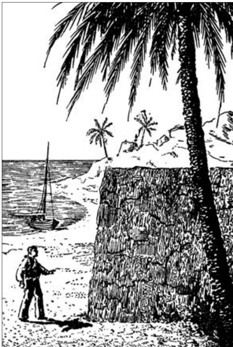
Рис. 2. Задача Едісона: потрібно без будь-яких знарядь зсунути з місця тритонну гранітну скелю завдовжки 100 футів і заввишки 15 футів