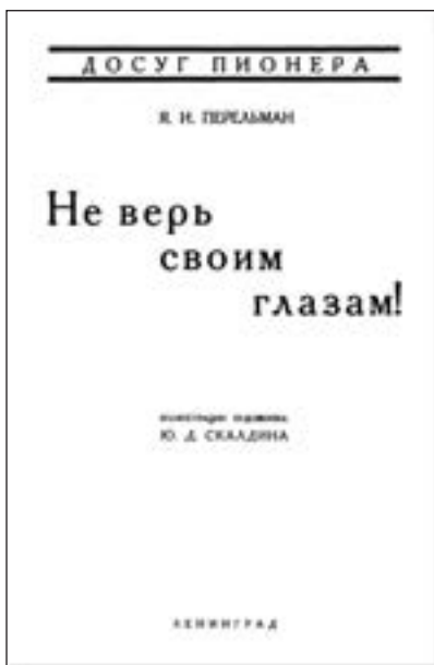
Титульні сторінки брошур «Для юних фізиків» (2-е вид., 1929 р.) та «Не вір своїм очам!» (1926 р.)

про ще одну свою невеличку брошурку «Не вір своїм очам!» 1 ). Однак звірка з оригіналами показала, що «влиття» було неповним: ціла низка сюжетів узагалі не була перенесена в нове видання, а в тих, що переносились, як правило змінювалися ілюстрації, часто не на кращі. Тому ми вирішили відновити усі такі «втрати».