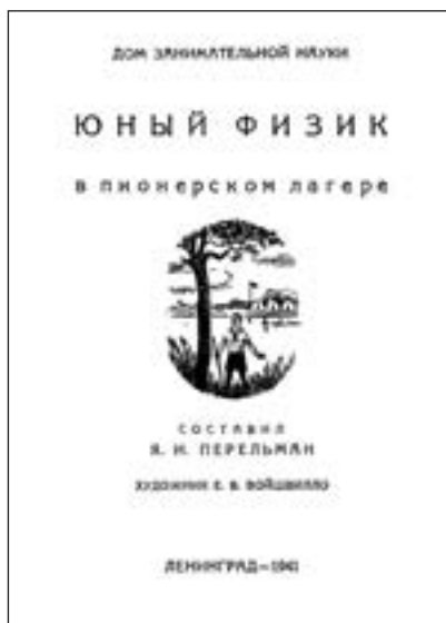
Титульна сторінка брошури «Юний фізик у піонерському таборі» (1941 р.) — логічного завершення «Фізики на кожному кроці»

Ця книжечка призначена для тих, хто ще не вивчав шкільного курсу фізики. Вона має своєю метою зацікавити школяра деякими фізичними явищами, які щоденно відбуваються в природі.