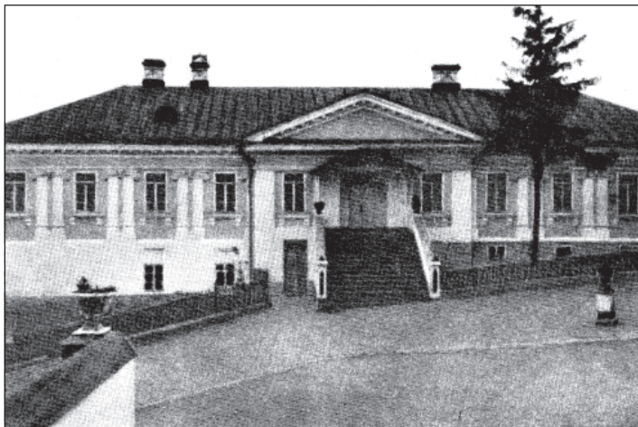
Готель Почаївської лаври, де зупинявся Т. Шевченко 1846 р.

У Почаєві Шевченко прожив два тижні. За цей час він намалював чотири акварельні малюнки і два ескізи: “Почаївська лавра із заходу”, “Вид на околиці з тераси Почаївської лаври”, “Почаївська лавра з півдня”, “Собор Почаївської лаври”.