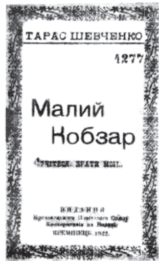
Т. Шевченко, “Малий Кобзар”, 1922 р.

На форзаци — репродукція портрета Тараса Шевченка з фотографії 1860 року. Коротка біографія поета “Життя Тараса Шевченка” поміщена на 3-7 сторінках. Далі друкуються вірші й уривки з поем Шевченка, всього 22 твори. Серед них на першому місці — “Заповіт”, подані