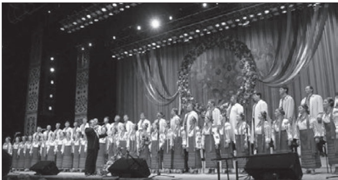
Національний заслужений академічний народний хор ім. Г. Верьовки

Щоби пісня прозвучала виразно і наспівно, її потрібно виконувати легким, округлим звуком. Дихання беріть активно й швидко перед початком кожного речення.