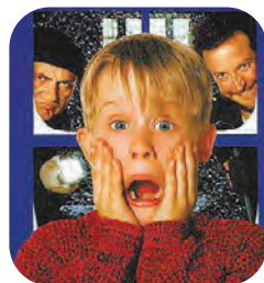
Постер до фільму «Сам удома»

«Щедрик» — відомий на весь світ твір українського композитора Миколи Леонтовича. Пісня стала настільки популярною, що її переклали різними мовами. Англійською вона відома як «Колядка дзвонів» (« Carol of the Bells »). Цей український шедевр можна почути у фільмах: «Сам удома», «Гаррі Поттер» тощо.