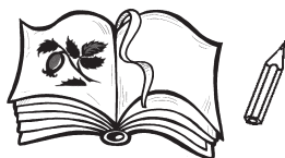
Рисунок в книге. Карандаш у книги.