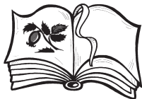
Малюнок в книзі Малюнок у книзі.

— Одинаковое ли значение в русском и украинском языках имеют одинаковые предлоги у , в ?