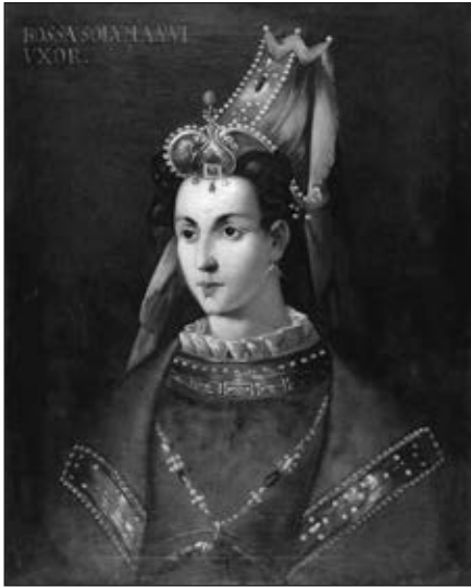
Роксолана. Невідомий художник. Топкарі müzesi