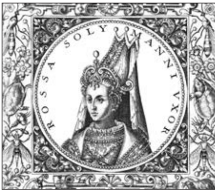
Роксолана. T. de Bri. Vitae Et Icones Sultanorum Turcicorum, Principum Persarum aliorumque illustrium Heroum Heroinarumque ab Osmane usque ad Mahometem II. Ad vivum ex antiquis Metallis effictae, primum ex Constantinopoli D. Imp... Civem Francforti, 1596. – S. 206

серію образів портрет Роксолани невідомого автора, створений масляними фарбами, зберігається у флорентійській галереї Уфіци і є, найімовірніше, авторською інтерпретацією двох попередніх її портретів. Адже зображена на ньому жінка темноволоса і похмура.