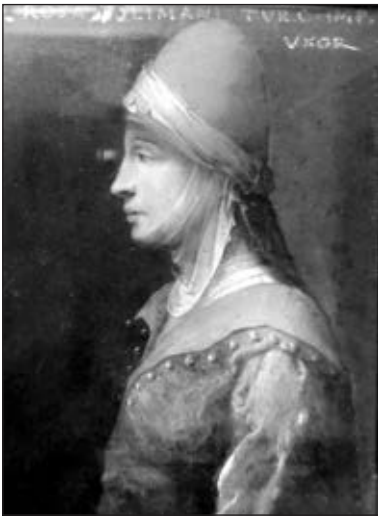
Роксолана. Невідомий автор. Kunsthistorische Museum (Відень)

блакитноока, білолиця українка, яку султан за її життєрадісний характер назвав Хюррем 17 , що з фарсі перекладається як радісна, весела, усміхнена, задоволена, свіжа, яскрава 18 . Про це свідчать рапорти венеційського посла П'єтро Брагадіно, котрий 1526 року писав, що султан не звертав на Махідеван уваги, а спілкувався лише з Хюррем, яка була не стільки красивою, скільки витонченою та мініатюрною 19 .