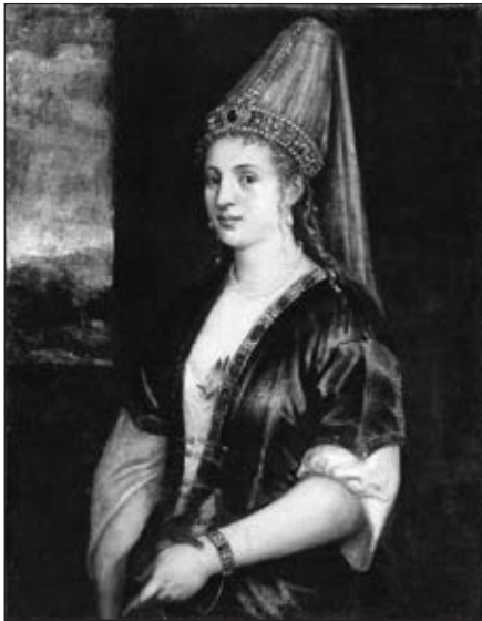
Роксолана. В. Тіціан. 1550-х рр. Ringling Museum of Art. Сарасота. США