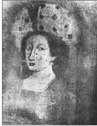
Роксолана у крапчастому береті. Невідомий автор. Uluçay M. Ç. Osmanlı Sultanlarına Aşk Mektupları. – İstanbul: Şaka matbaası, 1950. – S. 7

Сумніви у цьому посіяли її портрети невідомих художників. Один з них зберігається в історичному музеї Відня. На ньому Роксолана зображена у профіль з приспущеним прозорим яшмаком (чадрою). І тут її ніс не можна назвати кирпатим, радше – продовгуватим з горбочком. Те саме стосується й зображення Роксолани у крапчастому береті, яке оприлюднив турецький історик Мустафа Чагатай Улучай, та її образу пензля німецьких художників – майстра ребусів Ерхарда Шьона і гравера Ханса Зебальда Бехам. Два останні зображення було створено на основі портрета Роксолани роботи Міхаеля Остендорфера, намальованого 1548 року на замовлення італійського історика Паоло Джовіо 30 . Схожий на цю