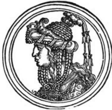
Роксолана. Ханс Зебальд Бехам. 1530 р. Universitätsbibliothek Erlangen-Nürnberg