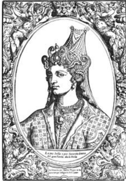
Роксолана. М. Пагані. 1540–1550 рр. British Museum

Цікаво, що цей портрет Тіціана невеликий – 98x74 см. Такою ж є і його картина «Роксолана Росса» (97x76 см). Тому ці дві роботи можна вважати ескізами, що зберігалися в майстерні Тіці-