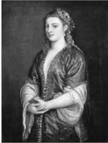
Портрет леді (Роксолани). В. Тіціан. 1555 р.

Її листи почали «дихати» квітучою, барвистою мовою, якою вона щебетала, немов соловейко, не лише про кохання, а й про релігійні та політичні справи 38 . Так, не раз у листах Хюррем, називаючи прекрасним лице султана, згадувала Юсуфа, який, за коранічними текстами, вирізнявся від інших людей надзвичайною красою 39 . У збірнику хадисів Мусліма йдеться про те, як пророк Магомет під час сходження на небеса дарував йому половину краси Адама, якого Аллах створив Своєю рукою, і надав йому найдосконалішого й найпрекраснішого вигляду. Від пророка Юсуфа божеволіли жінки, і він, щоб їх не спокушати, був змушений прикривати своє прекрасне обличчя накидкою. Проте одна жінка: дружина намісника фараона – у Корані, Потифара або ж Пентефрія – у Біблії виявилася наполегливішою у своїх домаганнях. Вона намагалася його звабити, однак той опирався спокусі. Розгнівана жінка звела на юнака наклеп, звинувативши його у спробі згвалтування. Її задум спершу мав успіх: Юсуфа засудили та ув'язнили. Згодом фараон виправдав невинуватого чоловіка, наділивши його за всі заслуги державною владою.