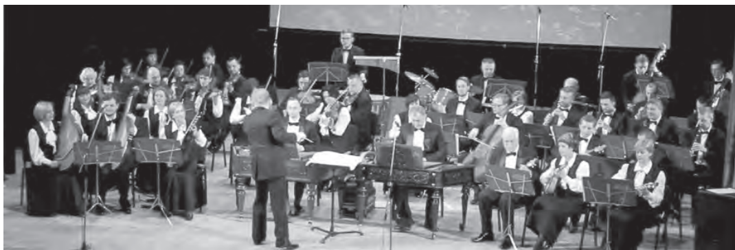
Національний академічний оркестр народних інструментів України

Дізнайся більше про склад Національного академічного оркестру народних інструментів України..