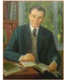
Л. Стебловська. Портрет Василя Сухомлинського (1918–1970), 2008.

III. Які ще значення можуть мати виділені слова поза цим контекстом?