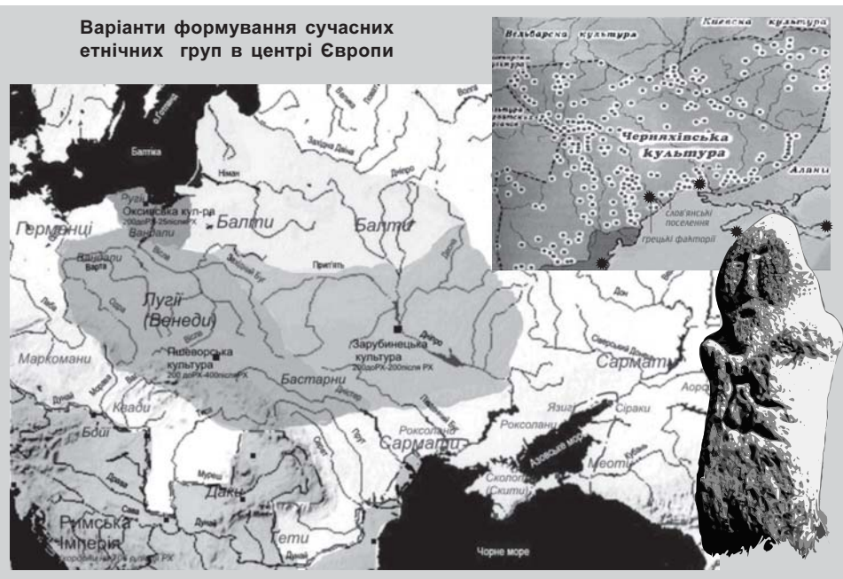
Варіанти формування сучасних етнічних груп в центрі Європи

Була поширена у верхів'ї Дніпра і вище, за участі слов'ян, балтів та фіно-угрів . Характерними є городища, укріплені валами і ровами у важкодоступних місцях, навколо яких розміщались селища. Населення займа-