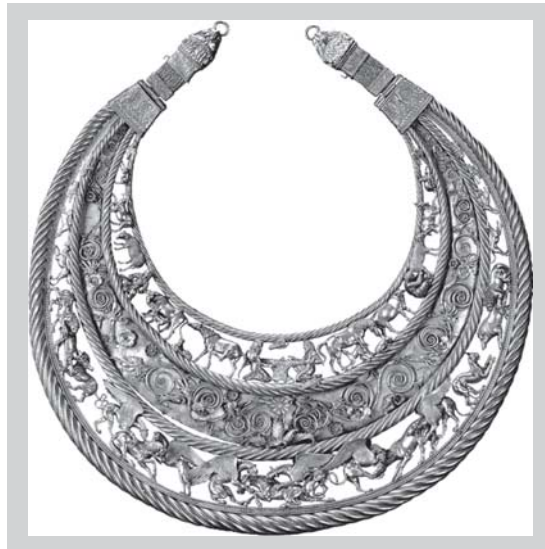
Скитська пектораль IV ст. до н.е. — свідчення духовної величі наших Пращурів

А скажи комусь: “А знаєте, що усі фундаментальні цивілізаційні досягнення походять з теренів Північного Причорномор’я?”, то отримаєш і лайку, і кпини, і підозрілу лютю... Все, що завгодно: і Нігерія, і Китай, і дельта Нілу, і Аравійська пустеля, і навіть Атлантида — аби лиш не чорноземи Украї-