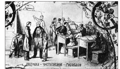
137. Недільна школа

З ініціативи передових українських інтелігентів відкривалися недільні школи, «де можна було вчитися вечорами та неділями робітникам та слугам неписьменним». Перша з них заснована в Полтаві (1858 р.) для хлопців та дорослих чоловіків від 6-8 до 50 років.