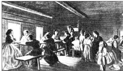
136. Початкова сільська школа 60-х рр. XIX ст.

У середині 60-х рр. XIX ст. в Росії проведено освітню реформу, яка стосувалася і підросійської України. «Положенням про початкові народні училища» (1864 р.) започатковано новий тип початкової школи — народне училище. Створено також керівні органи управління освітою — повітові й губернські училищні ради.